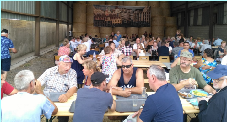
Le traditionnel jambon grillé a ravi plus de 300 convives.

Les amateurs de vieilles mécaniques ont pu admirer les nombreuses voitures anciennes et sportives, ainsi que les tracteurs et matériels agricoles anciens et contemporains.